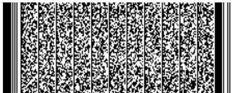
Timbre electrónico SRCell

Verifique documento en www.registrocivil.gob.cl o a nuestro Call Center 600 370 2000, para teléfonos fijos y celulares. La próxima vez, obtén este certificado en www.registrocivil.gob.cl .