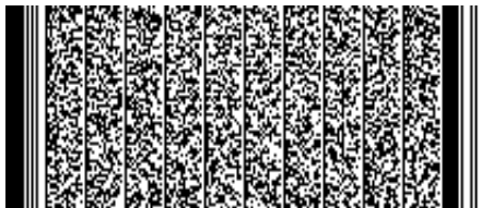
Timbre electrónico SRCell

Verifique documento en www.registrocivil.gob.cl o a nuestro Call Center 600 370 2000, para teléfonos fijos y celulares. La próxima vez, obtén este certificado en www.registrocivil.gob.cl .